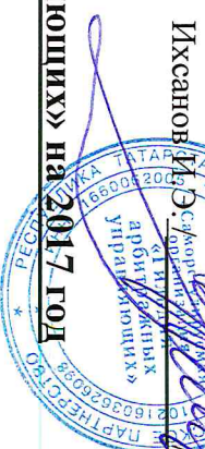
График плановых проверок членов НП «СРО «Гильдия арбитражных управляющих» на 2017 год