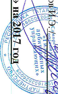
График плановых проверок членов НП «СРО «Гильдия арбитражных управляющих» на 2017 год